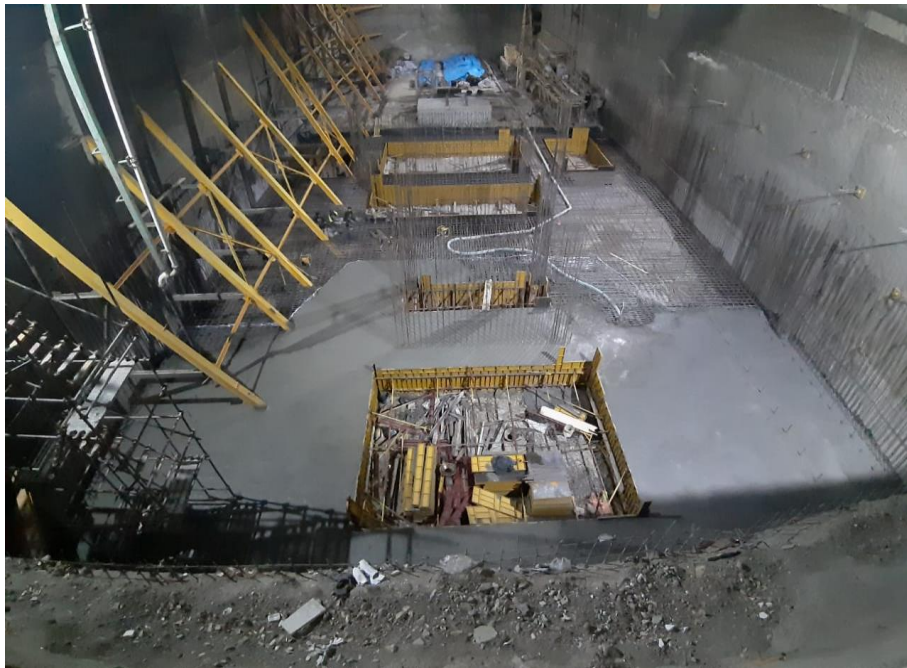
پروژه اجرای سازه بتنی واعظی در آیت الله کاشانی