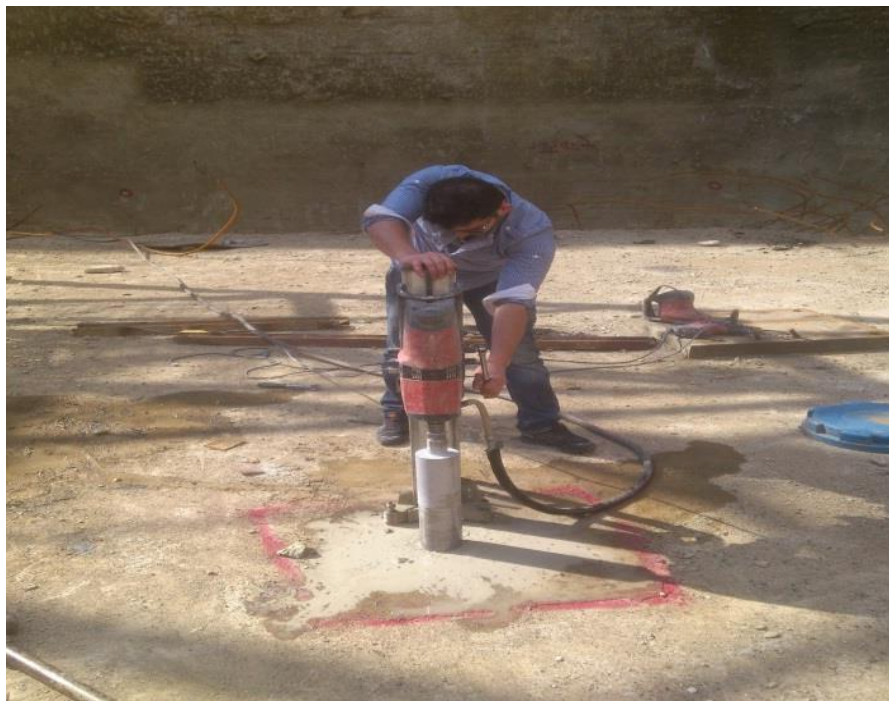
عملیات مغزه گیری از بتن فونداسیون پروژه رضایی در ورداورد