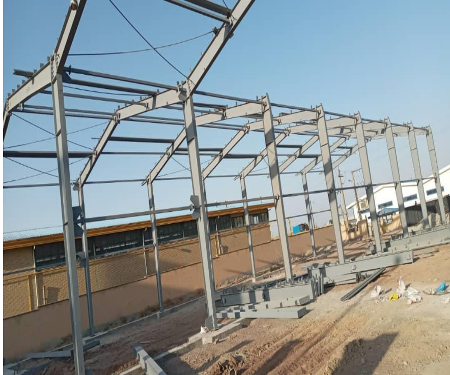
پروژه اجرای سوله شرکت بیم در اشتهارد