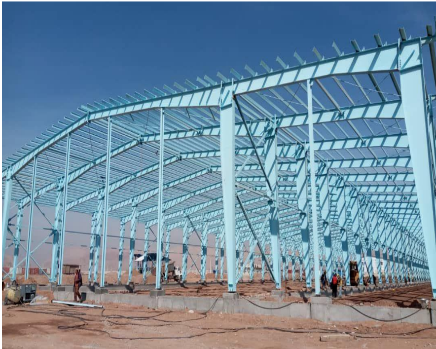
پروژه اجرای سوله منطقه ویژه اقتصادی گرمسار شرکت گلدیس رویا