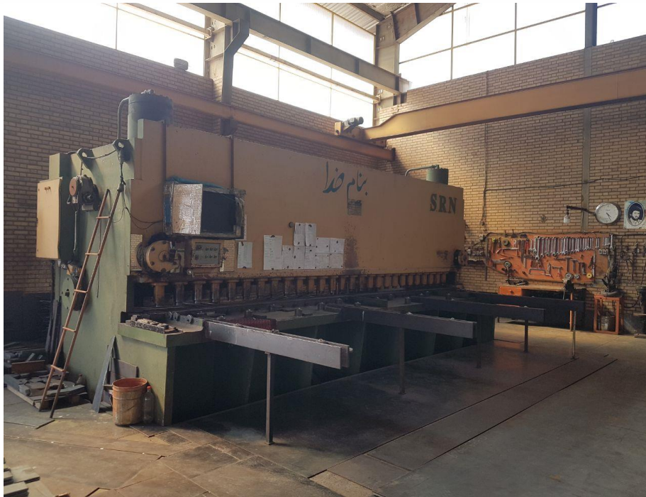
نمایی از کارخانه ساخت اسکلت فلزی