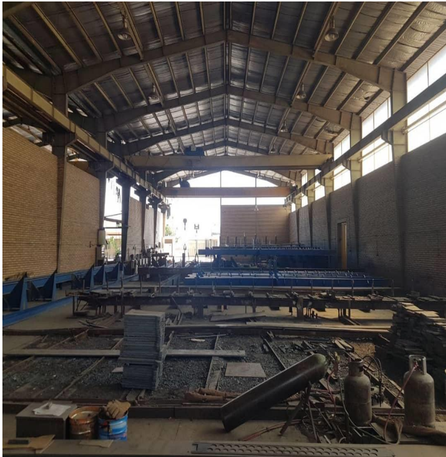
نمایی از کارخانه ساخت اسکلت فلزی

مقاوم سازی سازه مسکونی، تجاری، اداری، صنعتی