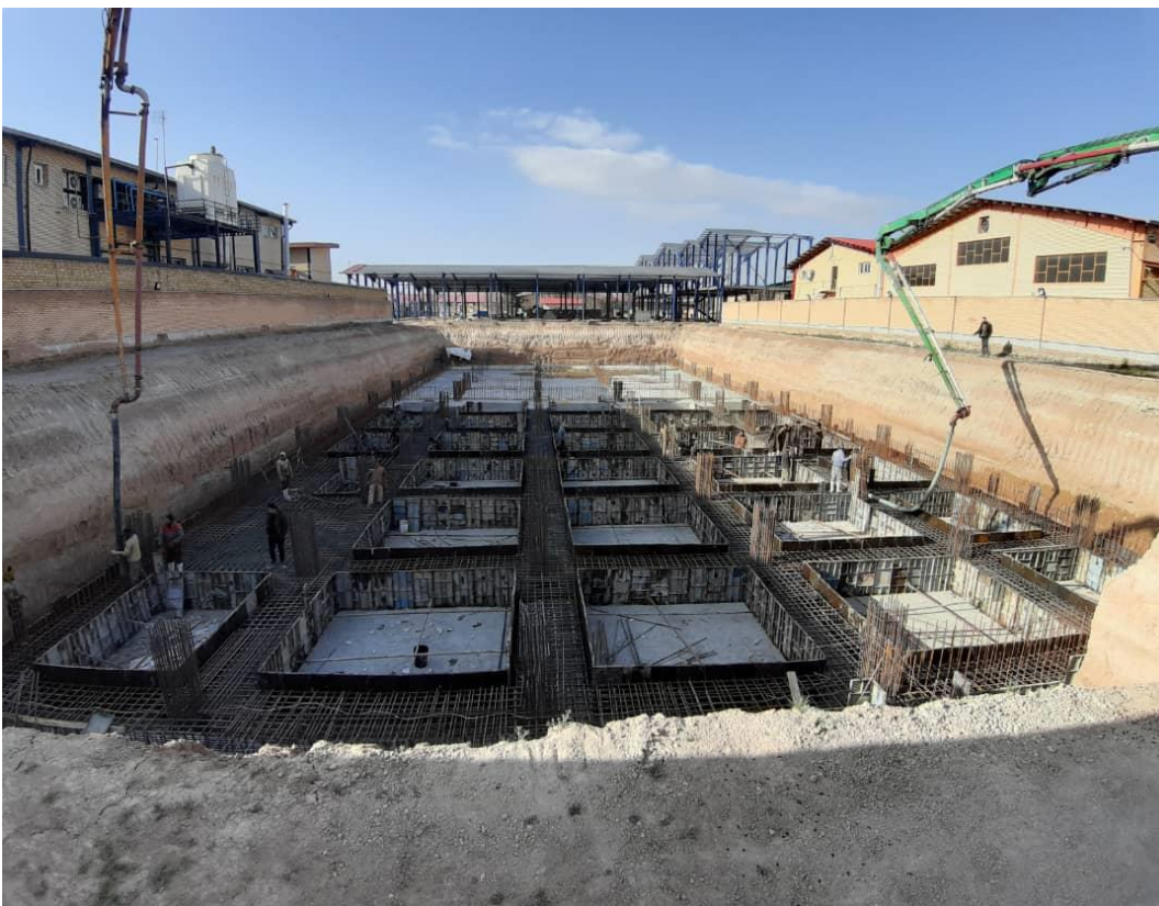
پروژه احداث خط تولید کارخانه آبمیوه مجتبی

تهران، میدان المپیک، شهرک صدر، خ ساحل، ک بهرامی، پ 7، ط همکف کدپستی 1485856463 تلفن 44151362 www.arasaze.ir