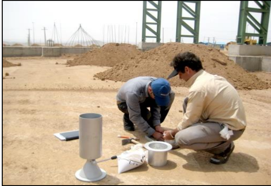
آزمون تراکم زیرسازی پروژه بیمارستان یافت آباد