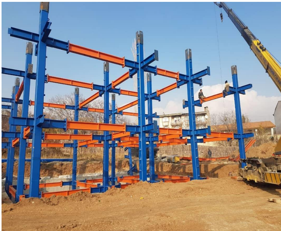
پروژه اسکلت فلزی ۳۵۰ تنی با پیچ و مهره آقای علوی در دماوند