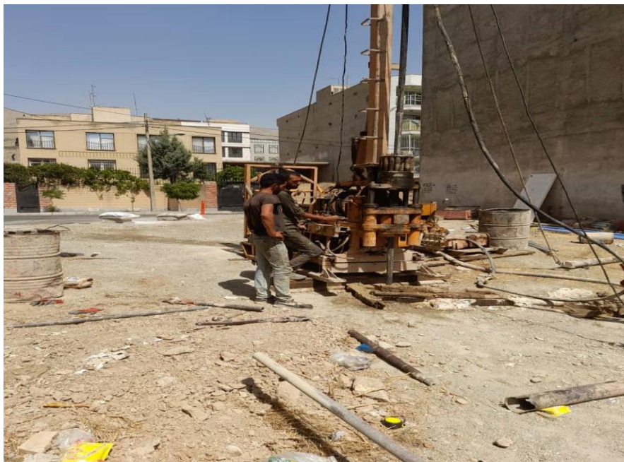
مطالعات ژئوتکنیک پروژه آقای فتحی در شهرک گلستان